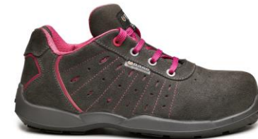
ATTITUDE B0670 - wariant kobiety roz. 35-42