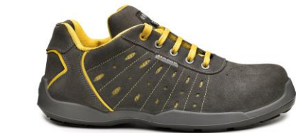
SMASH B0672 - wariant kolorystyczny