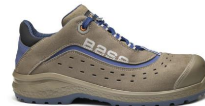
Bliźniaczy model B0885 BE-ACTIVE drugi wariant kolorystyczny

Oddychająca cholewka z mikrofibry z odblaskową wstawką 3M